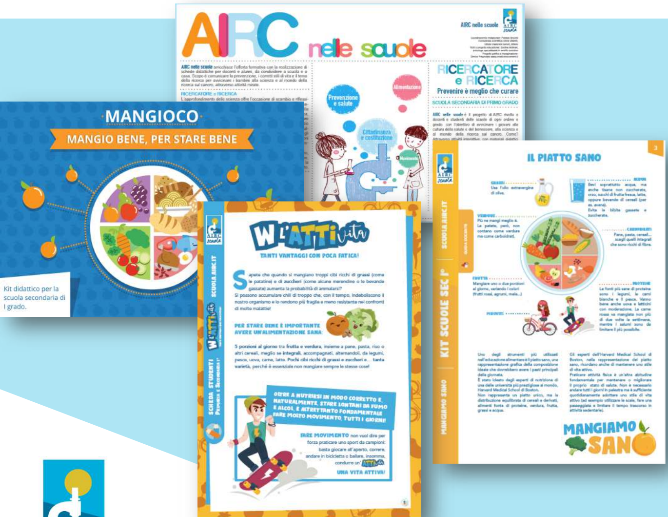
Kit didattico per la scuola secondaria di I grado.

Tanti percorsi e materiali didattici per coinvolgere la classe in letture, quiz, laboratori e giochi alla scoperta delle abitudini salutari e delle STE(A)M. Tutti i kit sono completi di guida docente.